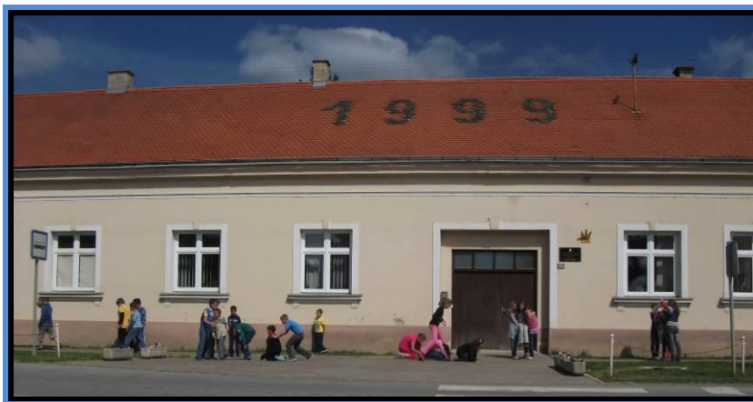
PRO STARI SLATNIK