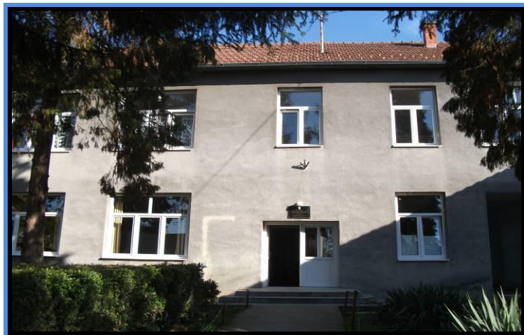
PRO GORNJI ANDRIJEVCI